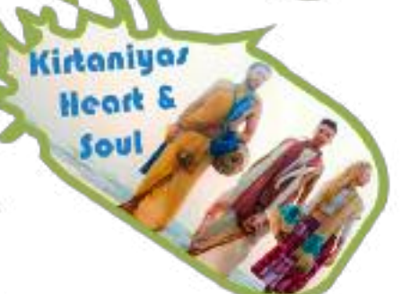
Kirtanias Heart & Soul