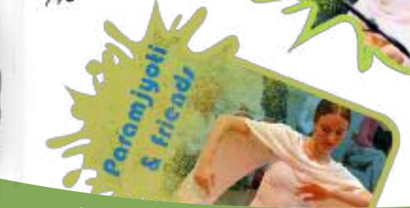
Paramjyoti & friends