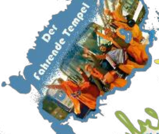
Der fahrende Tempel