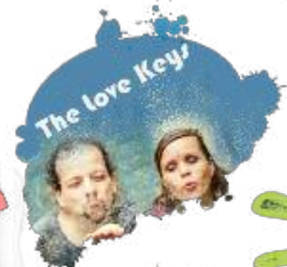
The Love Keys