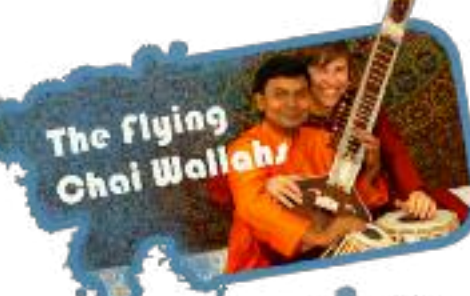
The Flying Chai Wallahs