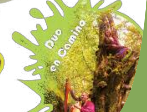
Duo en Camino