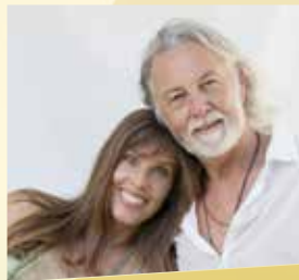
Deva Premal + Mitun

Alle Details zu den einzelnen Programmpunkten findest du hier: yoga-vidya.de/musikfestival