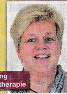
PLIETSCH Beratung Coaching Psychotherapie

Tel: 040/943 623 81 Tel: 0151/27 52 86 04 www.heilpraktiker-oase-hamburg.de