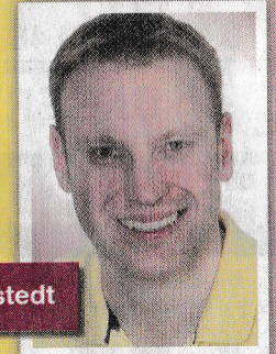
Yoga Vidya Norderstedt