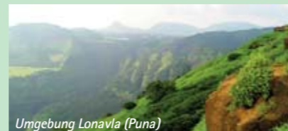
Umgebung Lonavla (Puna)